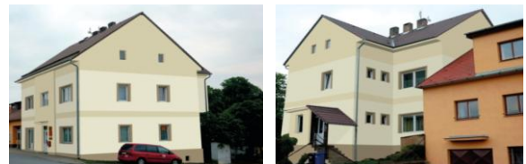
Varianta č. 2